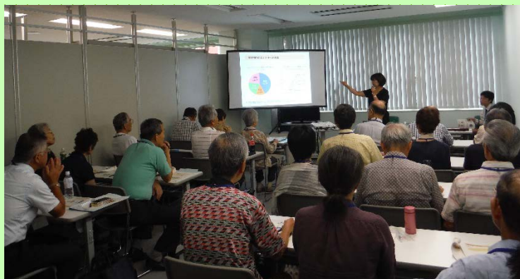
平成27年度(第1期)の様子